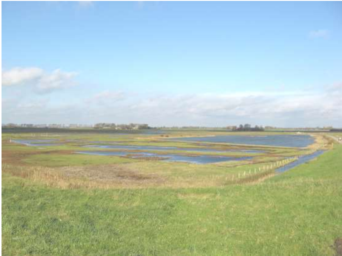
Foto 2011. Zuid-westhoek van Schakerloo. Natuurgebied. Enkele percelen bouwland zijn afgegraven en samengevoegd met de langs de zeedijk gelegen karrevelden. Op de achtergrond de hofsteden Gortzak en Kettinghoeve.