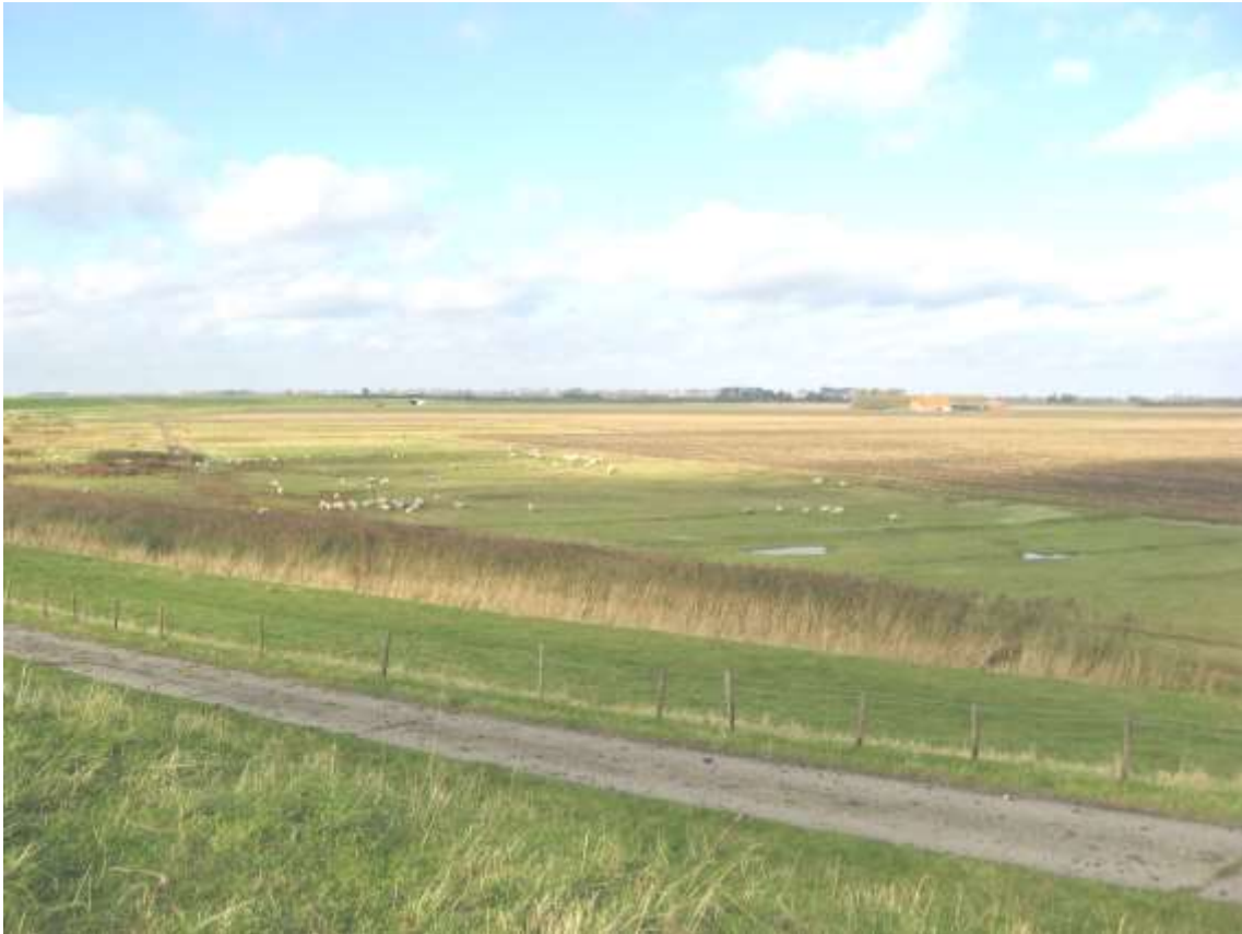
Foto 2011. Zuidzijde van de Polder van Schakerloo.