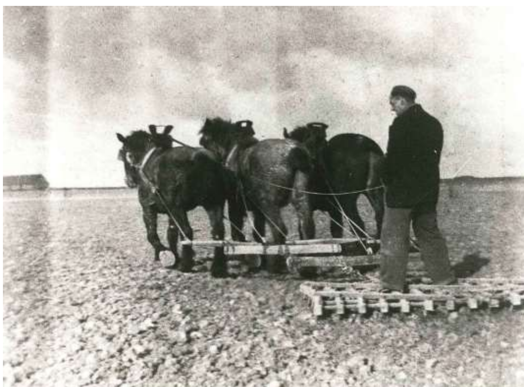
Het zaaiklaar maken van het land door het eggen met driespan op de hofstede Bouwlust te St. Philipsland.