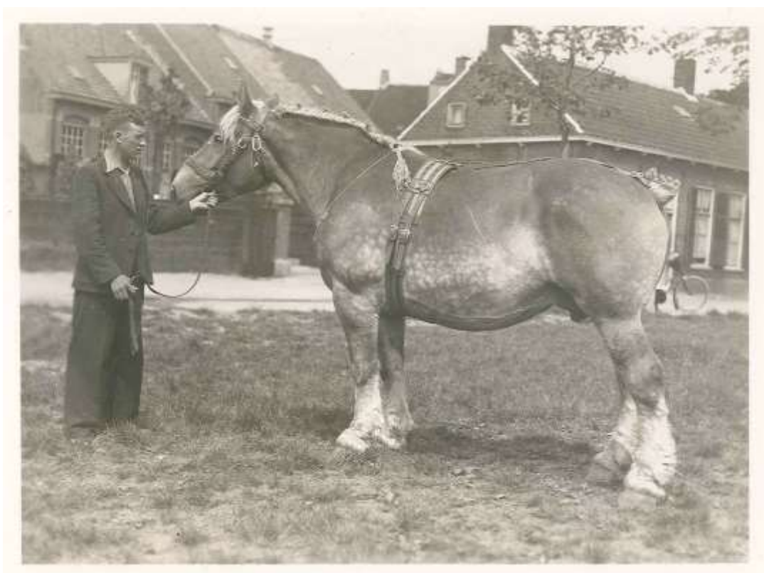
St.Philipsland foto ca. 1925. Hengst bij fam. Stols.

Aantal paarden Sint Philipsland: 69 71 71 73 75 75