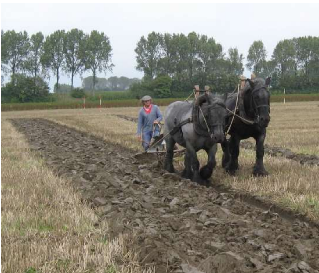
Ploegen met tweespan.