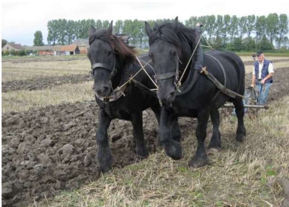
Ploegen met tweespan.